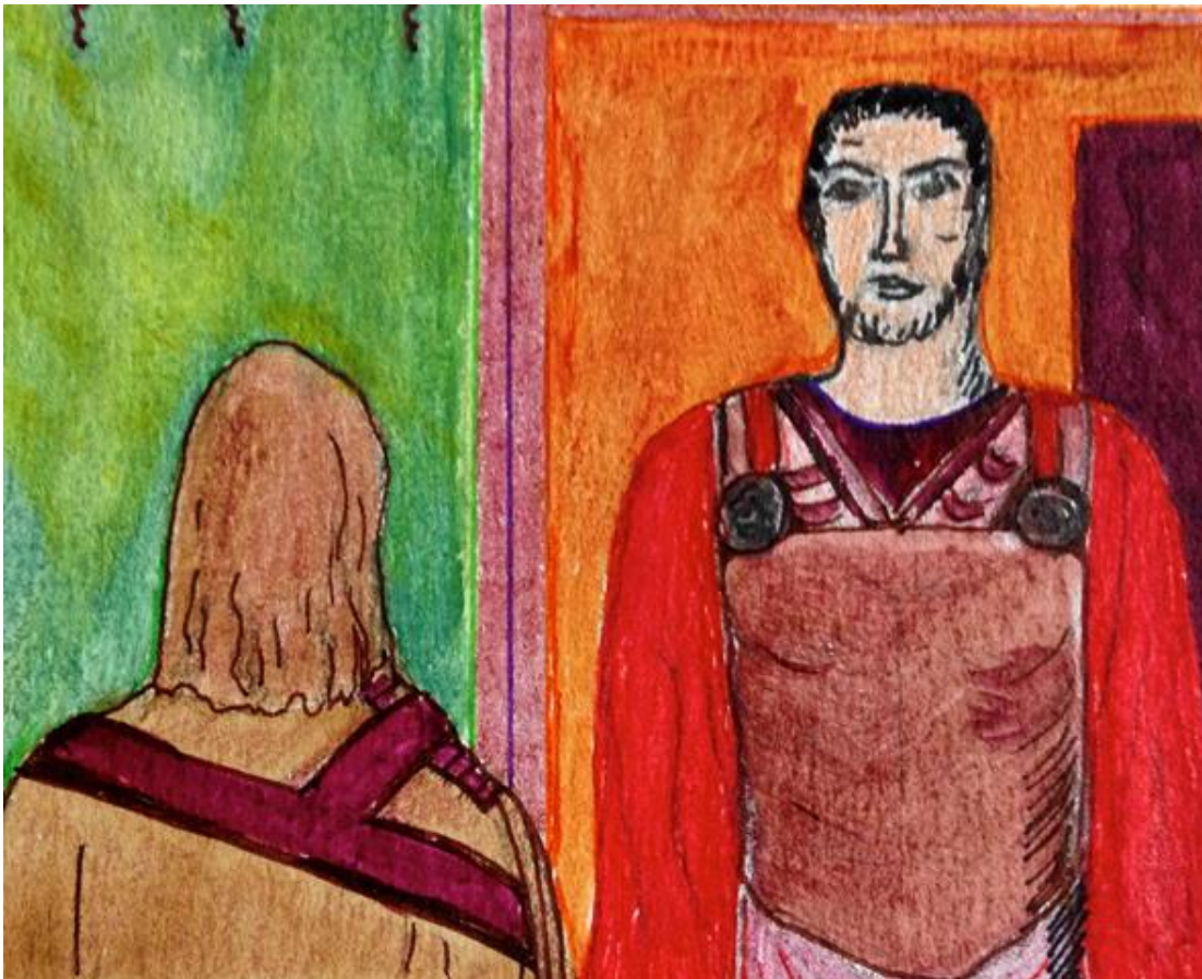
Fleury-Mérogis eko atxilotuek egin marrazkia.

"Hautua baginuen, gaizkia hautatu dugu. Legea hautsi dugu, jujatuak gira, normala da. Auzitegian, beldur gira, gure buruaz deskonektatuak bagine bezala. Gure bizi guzia ezagutzen ez ditugun jende batzuen aitzinean behar dugu botatu, ez gira gehiago pertsona bat. Auzi denboran, ez da gehiago lekurik barkamenarentzat. Zigorra entzutean, barnez inarrosiak gira. Gure burua lehertua balitz bezala. Gristino izanez, otoitz egin dut. Bainan otoitzak ere ez daut deus ekarri ! Geroago, pentsatu dut otoitz hori bestela behar nuela egin. Zigorak ohartarazten daut bekatoros bat naizela.