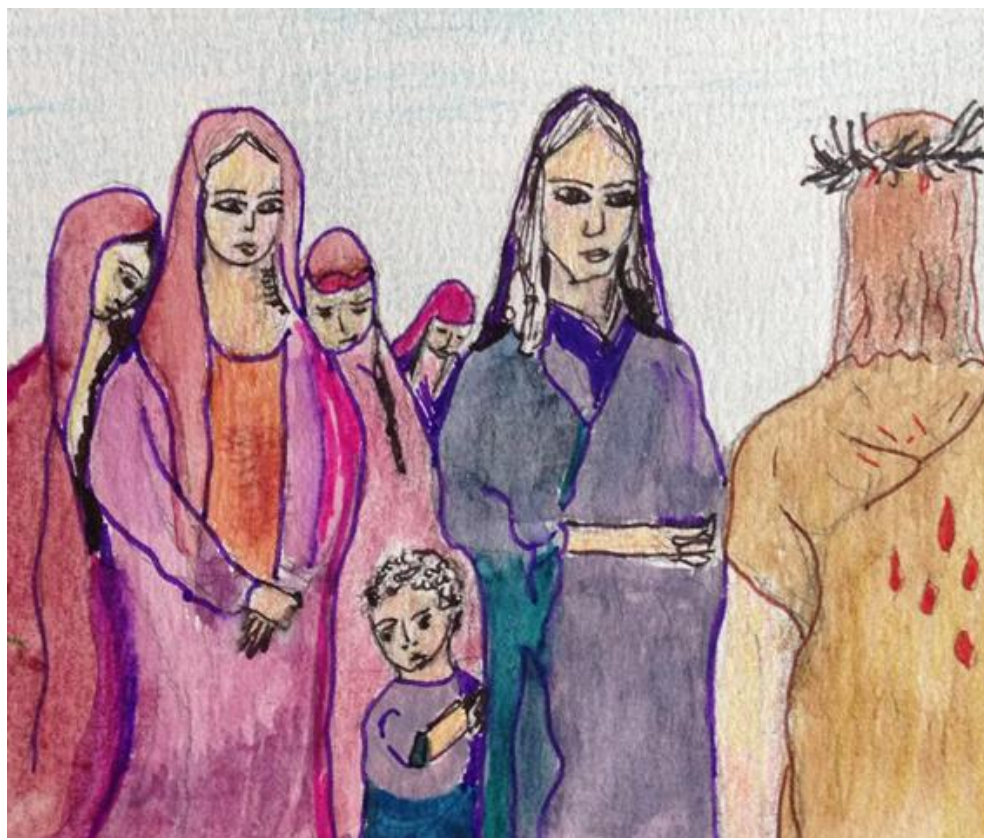
Fleury-Mérogis eko atxilotuek egin marrazkia.

"Gizon gaixtoari min egiten diogularik, gizon onari ere berdin min egiten diogu. Ez da nigar egin behar Jesusen heriotzaren gatik, baina bai guk egin gaizkiaren gatik. Gaizki horrek gure hurbilekoen ganik bereizten gaitu, haiek ere gu gabe gelditzen direlarik, jakinik ere ez dela betikotz."