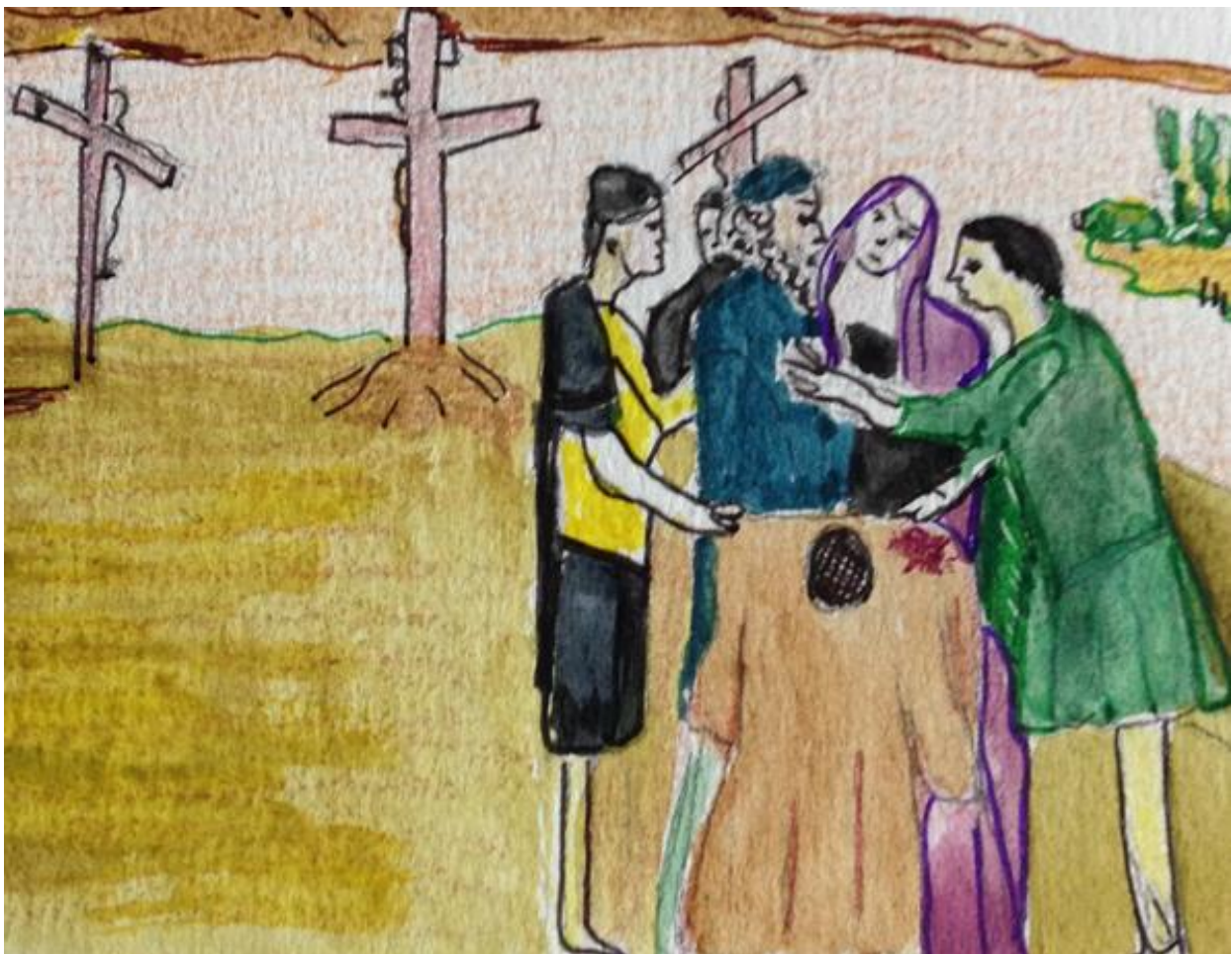
Fleury-Mérogis eko atxilotuek egin marrazkia..

"Nere askatasuna, nere intimitatea eta ontasunak galdu ta, biluzik nago. Kanpotiar naiz, nere hitzak ezin ditut partekatu, atxilotzeak hautsi nau. “Ez huen hunarat jin behar, ez huen astokeriarik egin behar”. Utz nezazue nere hutsen pagatzerat duintasunez. Nere duintasuna galtzen badut, nere arimaren arropak galtzen ditut, nere begien argia da itzaltzen. Kristoren begien pean egonez, nere duintasuna beiratu dut, hura otoiztuz, presondegiak biluzi nau bainan ere irabazten lagundu. Emanez, utziz leher egin gabe, handitu naiz, bertzearen sofrikarioari ideki naiz."