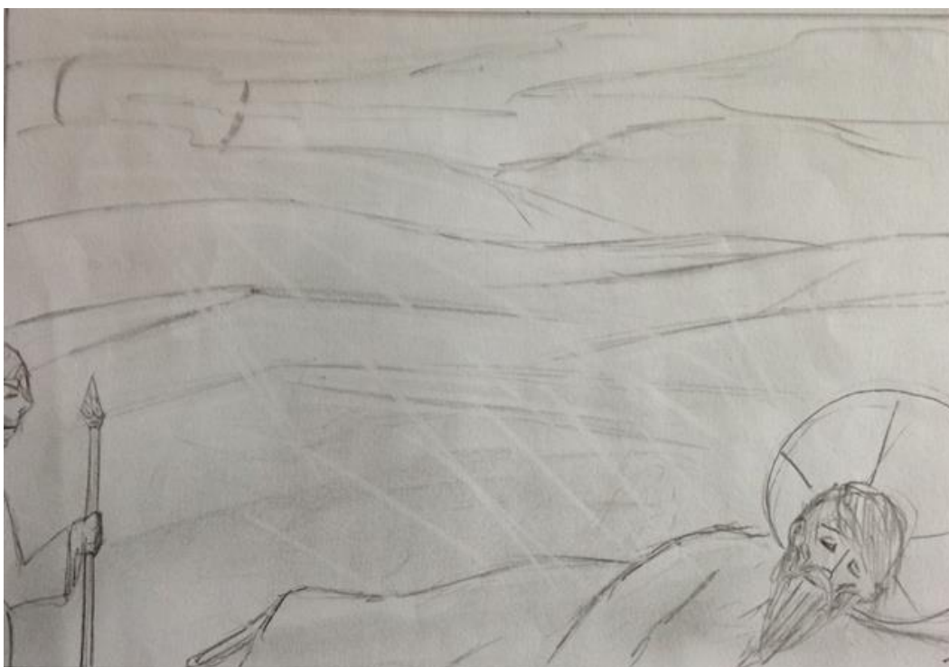
Fleury-Mérogis eko atxilotuek egin marrazkia.

"Atxilotua izan aitzin, diru aise bilduaz lilluratua nintzen. Badakit hemen naizela orain, ez dutalakoan behar zena egin . Dena galtzen dugularik, orduan gira ohartzen ez zuela balio holako bide bati lotzea. Presondegian sartzean, ainitz gauza aurdiki dira nere inguruan. Belauniko banintz bezala. Dena egiten dut ez arras erortzeko. Emeki emeki xutitzerat entseiatzen naiz. Batzuk azken mugetaraino aspertzen banaute ere.”