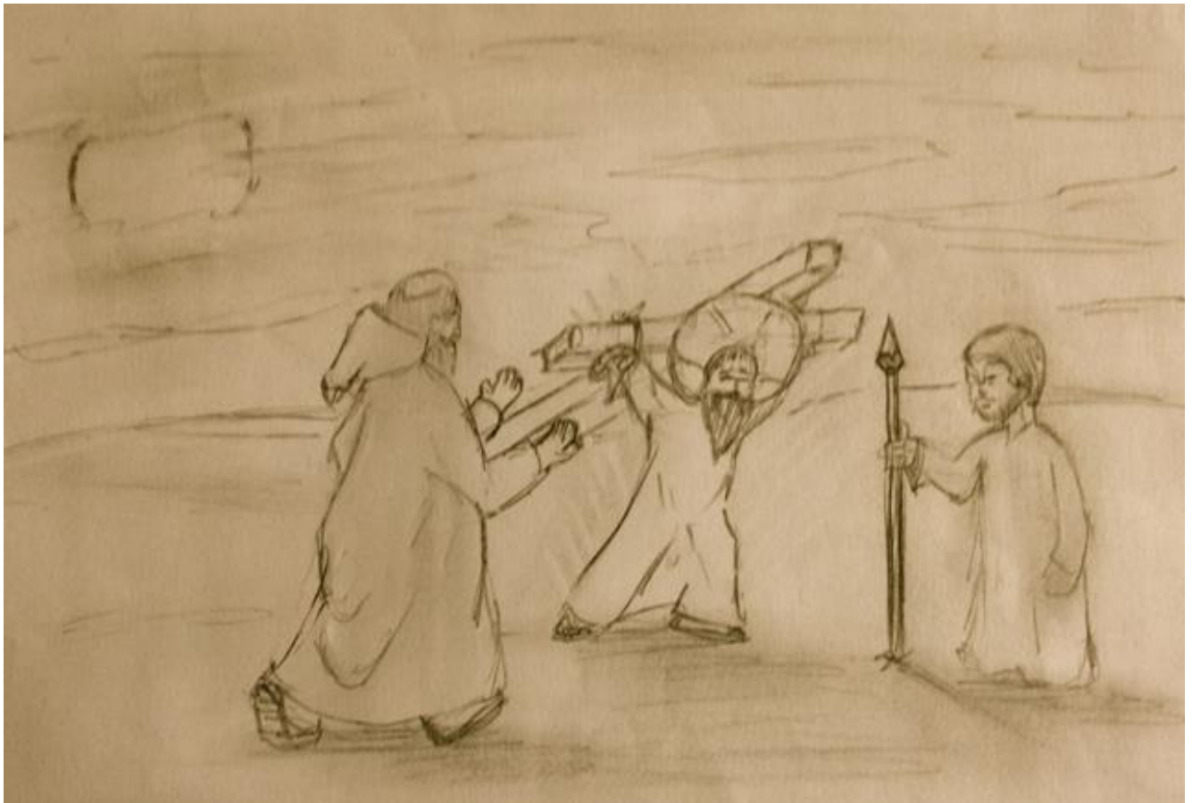
Fleury-Mérogis eko atxilotuek egin marrazkia.

" Zimun Zirenearrak ez zuen berak hautatua Jesusen gurutzea garraiatzea. Konfiantzaz onartu du misione hori. Ez dut hautatu nere presondegi gelako laguna; alta bada, ohartu gabe ere, egun guziez elgarri kasu egiten dugu. Hemen, giltzapean, estonatu naiz uste baino gehiago elkartasun kausitzeaz. Hemen egiazki elgar laguntzen dugu. Kanpoan nintzelarik, ez nuen uste nere laguntza eskain nezakeela. Laguntzeak burua uretik kanpo beiratzten daut."