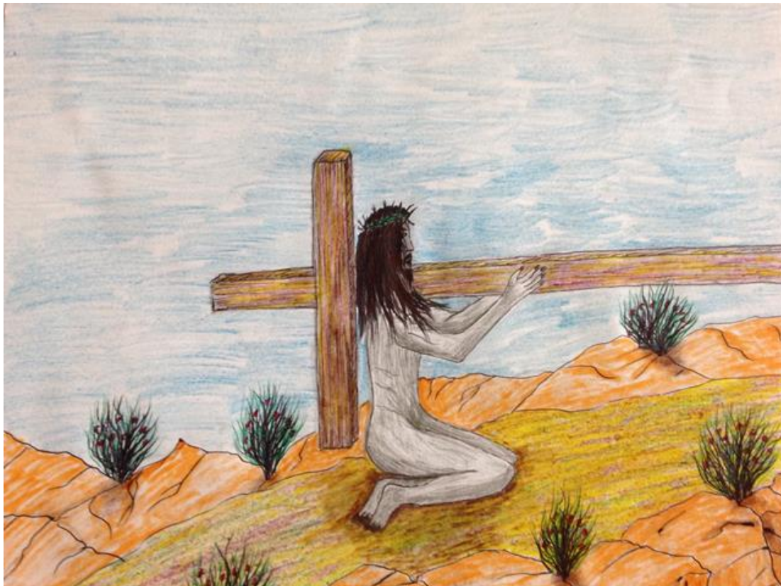
Fleury- Mérogis eko atxilotuek egin marrazkia.

"Erortzea, lurreratzea da. Bietan erortzea, gaitzaren mintzea ! Atxilotzeak gure gizatasuna errausten dauku. Gure biziak aurdikitzen dira, puskatzen. Zoiziateak botatzen gaitu, eskubide eta askatasun guziak kentzen. Sofritzen dugu, triste gira, familiako loturak galdurik. Batzutan, guhaurek dugu gure burua preso ezartzen : espiritual mailean, edo gorputzekoan... Ni aldiz, Kristoren ganik hurbildu naiz : Jainkoaren Hitzari esker, edertasun, argi eta indar atxeman dut. Otoitzak bestelakotzen lagundu nau. Esperantza eta zigorraren soportatzeko indarra ekar dezake. Nik otoitzean, bizi berri bat, berpizte bat galdegiten dut.”