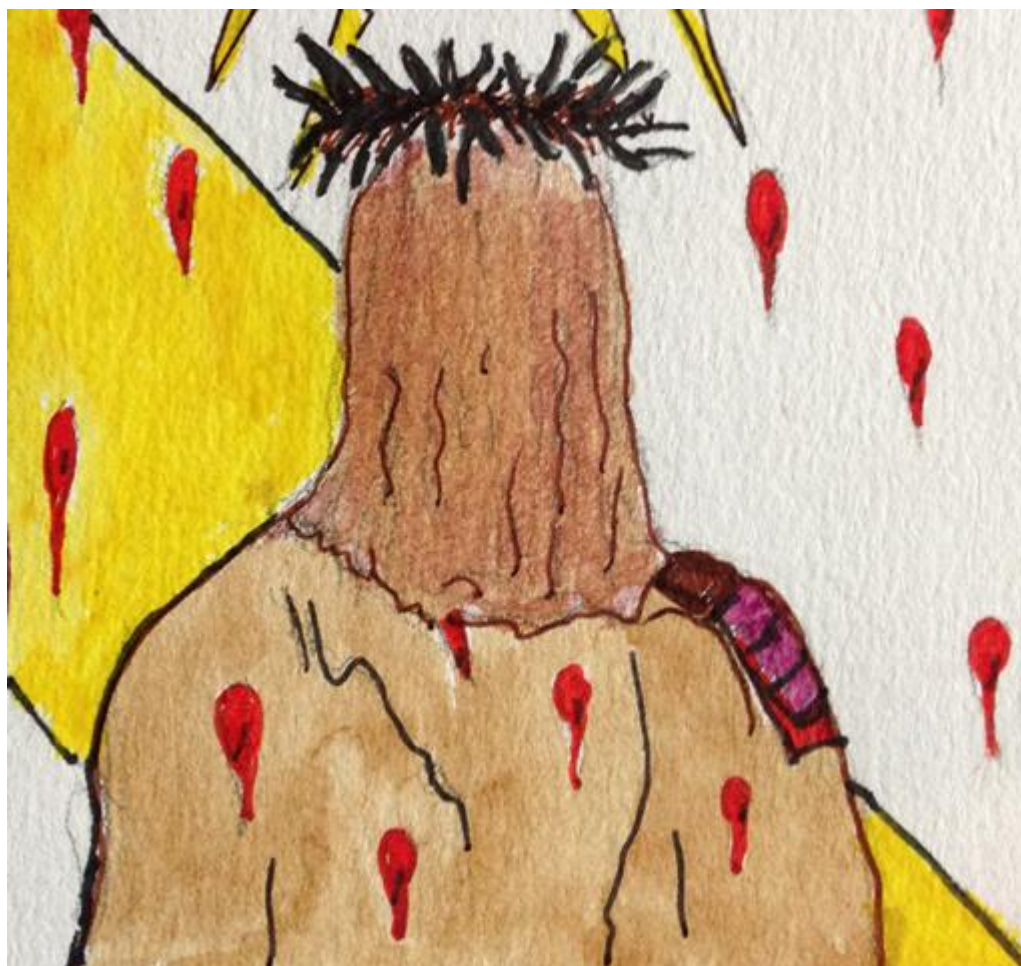
Fleury-Mérogis eko atxilotuek egin marrazkia.

"Gozotasuna bada, edo herra da. Goxotasun aurpegi guti ikusten dugu. Adiskideak kanpoko ibilaldian, bisita bat mintzalekuan, permisione baten berria... Goxotasunaren giblean, haserre parte bat atxikitzen dugu beti. Gozotasuna, izan daiteke ere gure zaindari baten agurtzea."